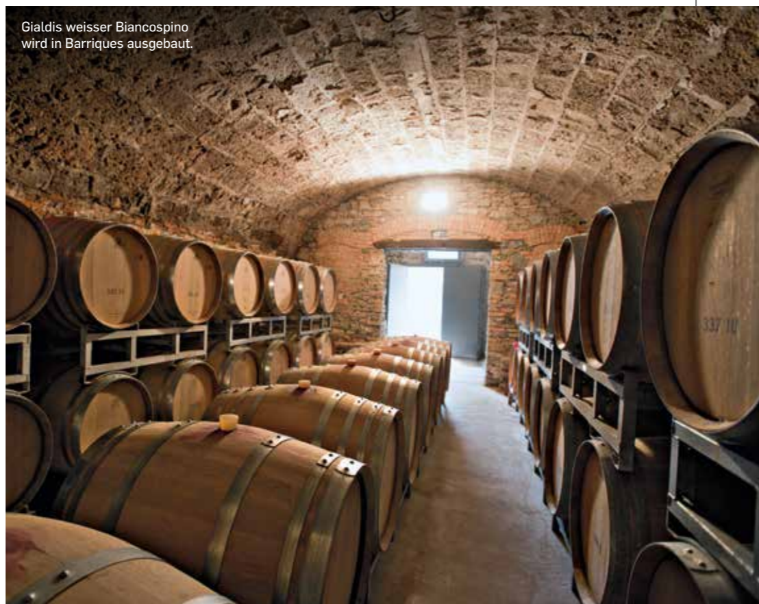
Gialdis weisser Biancospino wird in Barriques ausgebaut.

Die Weissweine fristeten dann bis weit in die zweite Hälfte des 20. Jahrhunderts ein kümmerliches Dasein. Einzelne Tropfen wie der Chasselas der Schule von Mezzana oder der Kerner der Terreni alla Maggia waren einsame Rufer in der Wüste. Die Tessiner sind eben keine Weissweintrinker. Den Touristen servierten die Restaurants Fendant oder Féchy aus der Westschweiz. Inzwischen